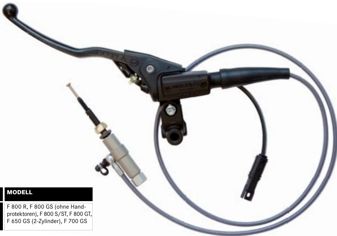
HMEC für F800